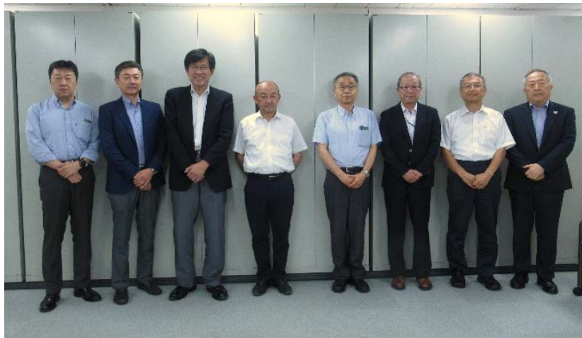
(写真 事業の円滑な実施を担う「技術検討委員会のメンバー」) ※ 外部委員10名で構成 (大久津委員、野入委員が欠席)

◎ 全日畜が実施するJRA事業「スマート畜産調査普及事業」では、7月4日に、事業の推進を担う第1回技術検討委員会を開催し最終年度となる、今年度の事業計画を決定しました。