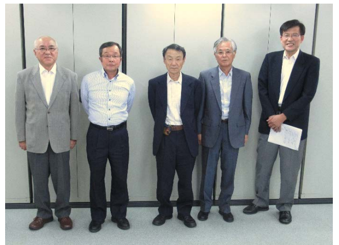
（写真 事業の実施を担う「調査事項検討会のメンバー」） ※外部委員5名で構成