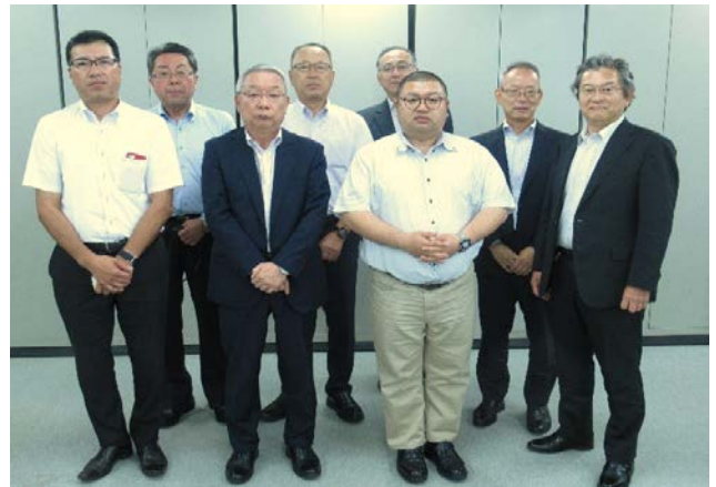
（写真 事業の実施管理を担う「推進委員会のメンバー」） ※外部委員10名で構成（松木委員、牧原委員が欠席）